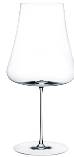
ND32019 Red wine レッドワイン 75(122)×H252mm 1000cc ¥12,000 \frac{1}{6} M