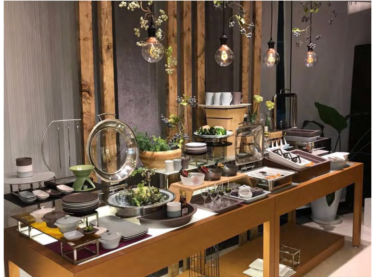
RAK GASTRONORM / ミヤザキ食器