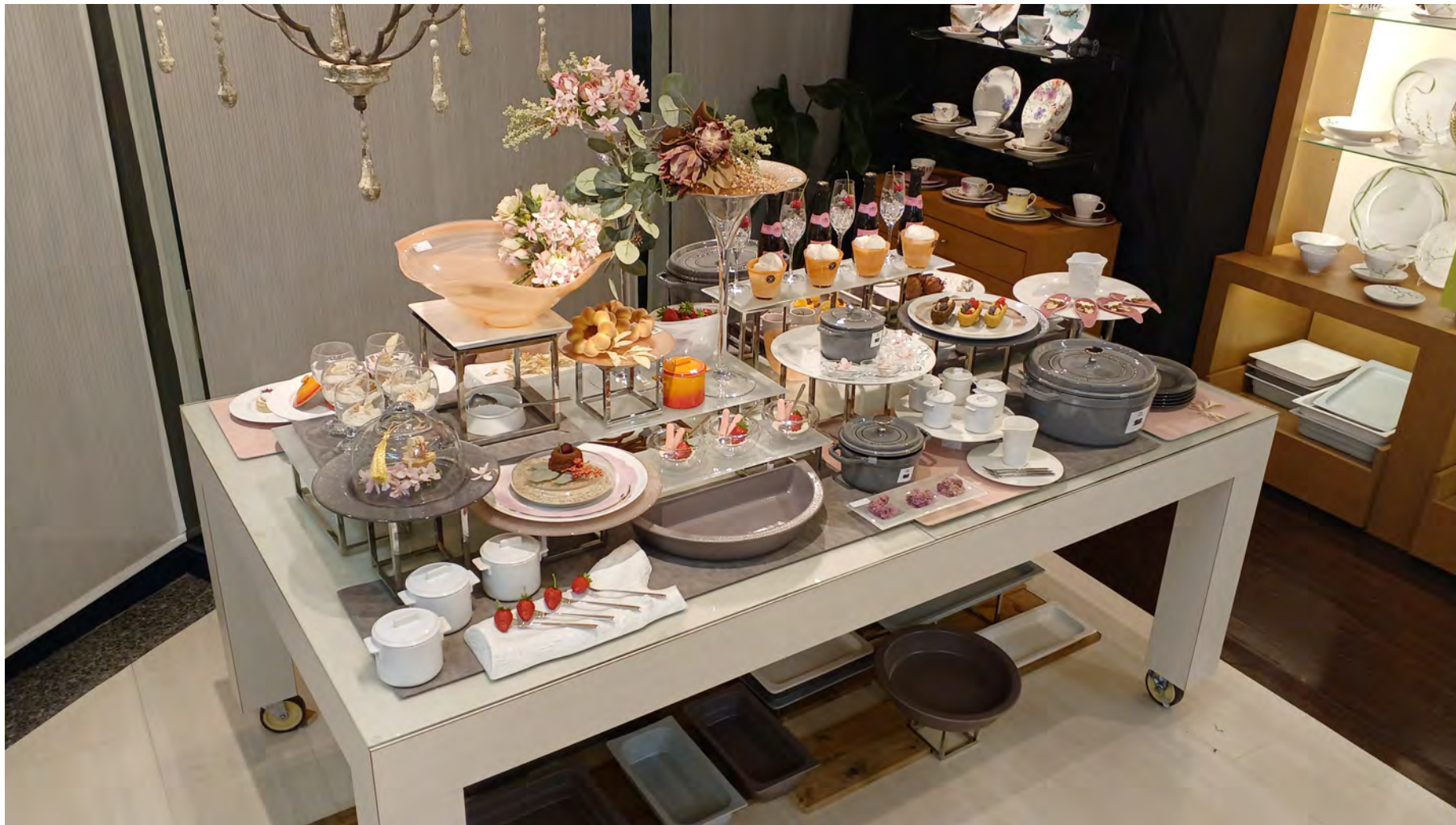
RAK GASTRONORM / ミヤザキ食器