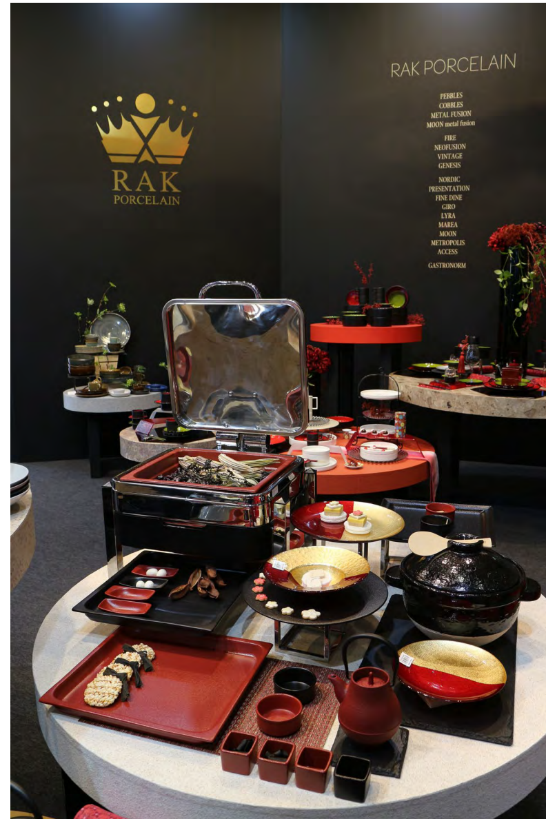
RAK GASTRONORM / ミヤザキ食器