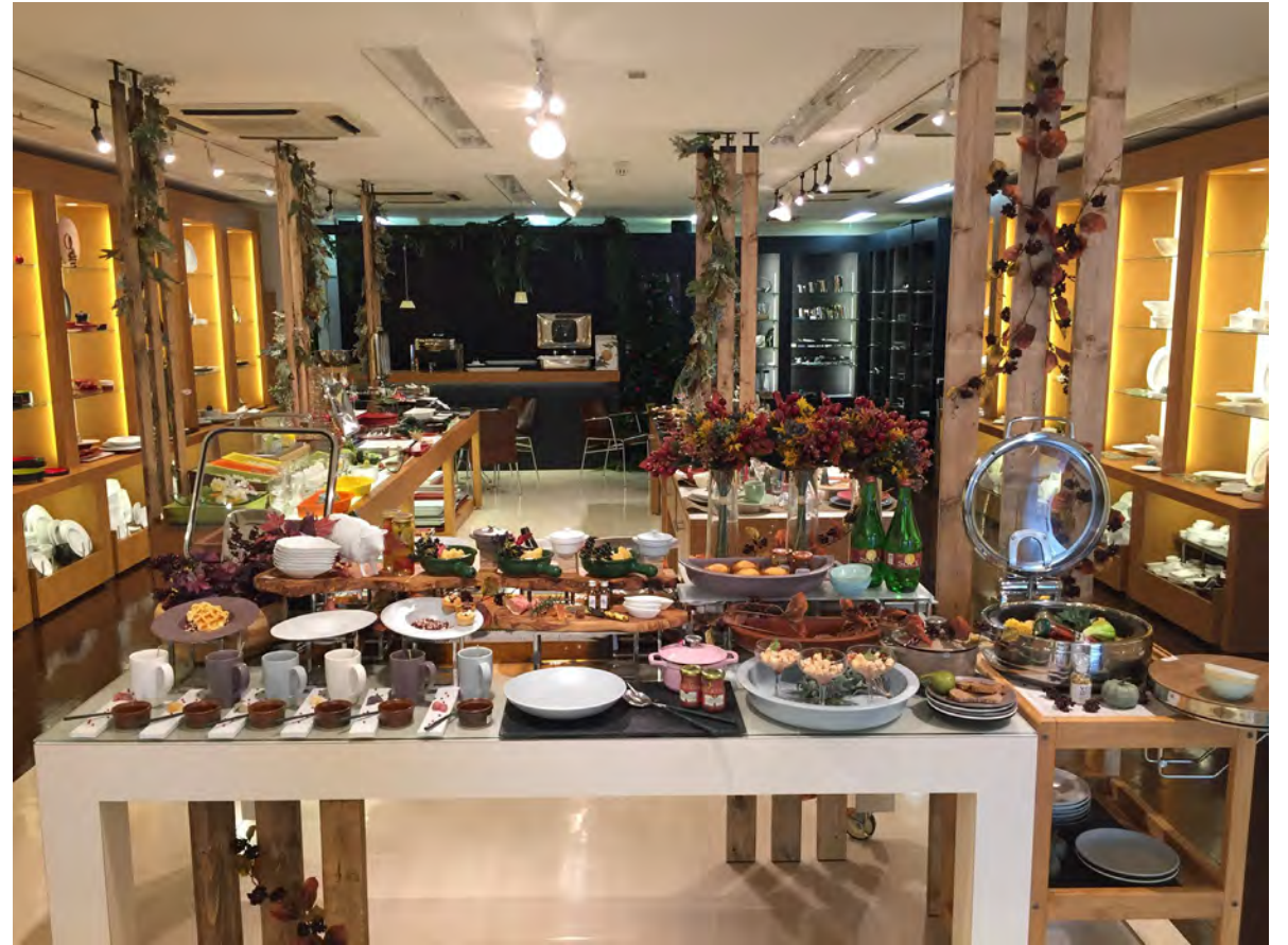
RAK GASTRONORM / ミヤザキ食器