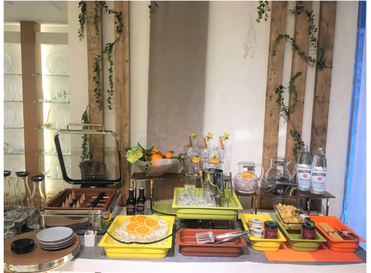
RAK GASTRONORM / ミヤザキ食器