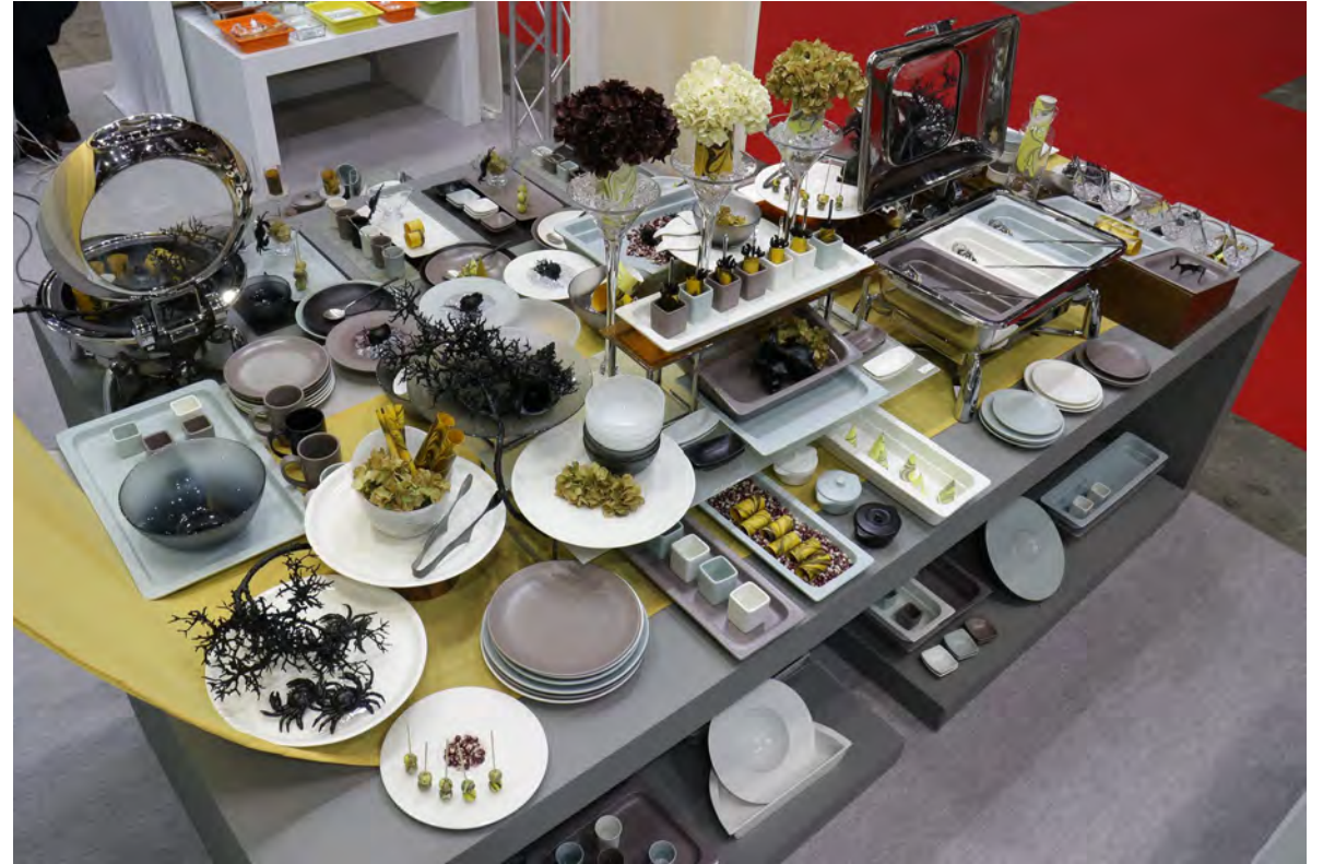
RAK GASTRONORM / ミヤザキ食器