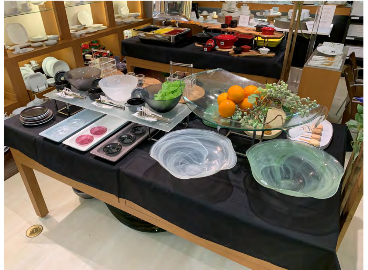
RAK GASTRONORM / ミヤザキ食器