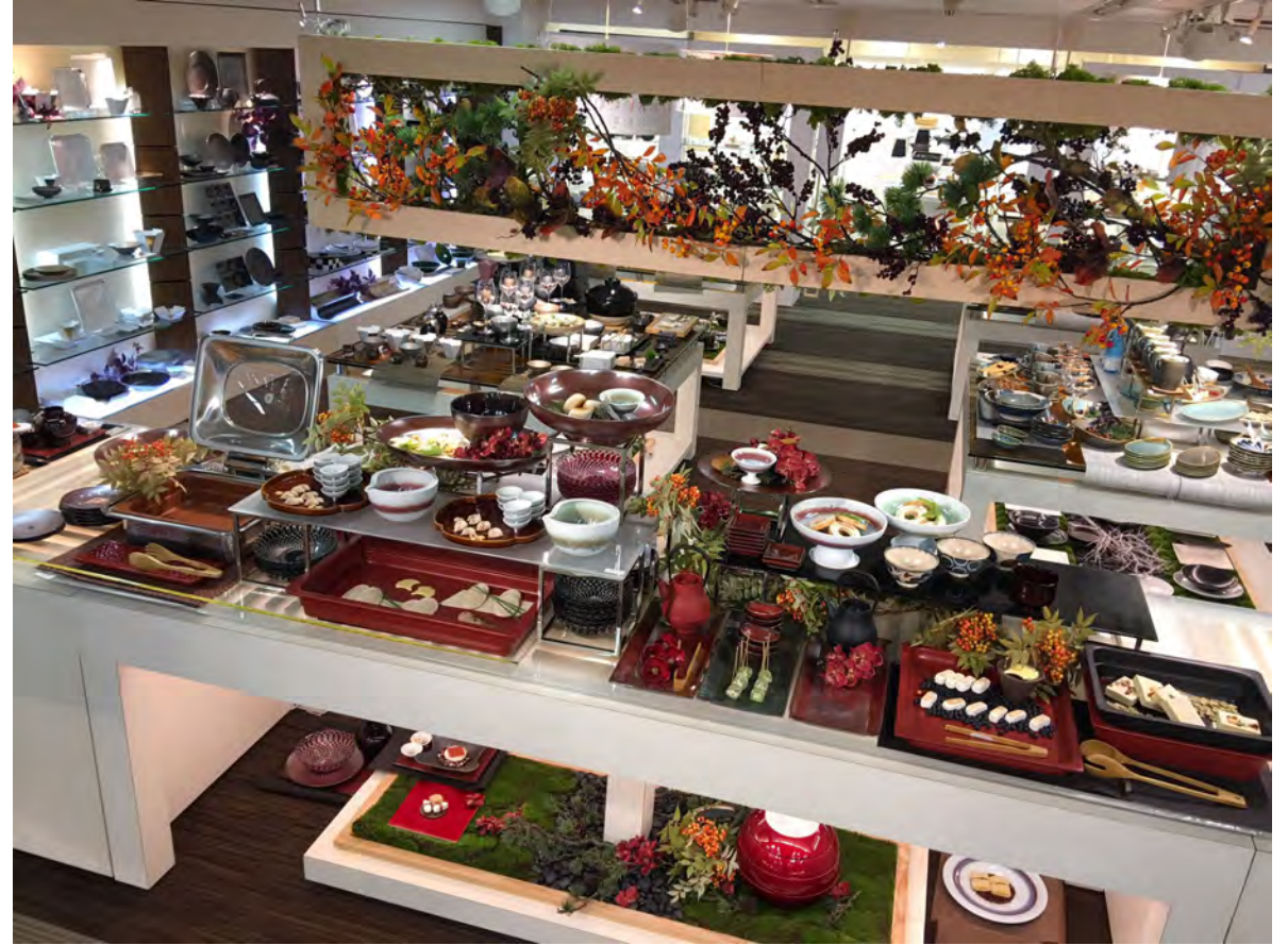
RAK GASTRONORM / ミヤザキ食器