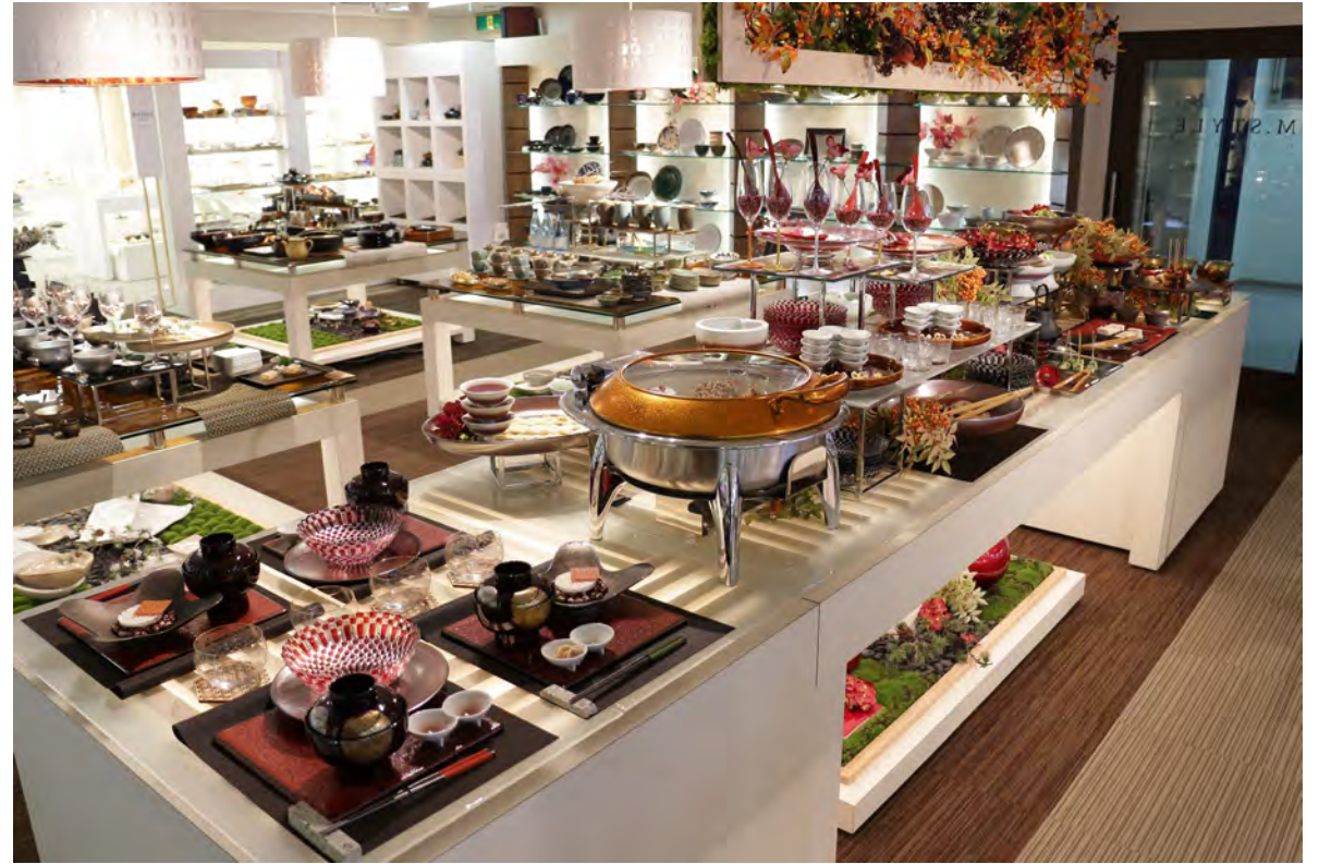
RAK GASTRONORM / ミヤザキ食器