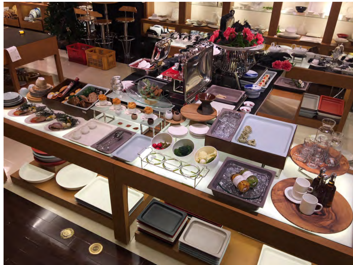
RAK GASTRONORM / ミヤザキ食器