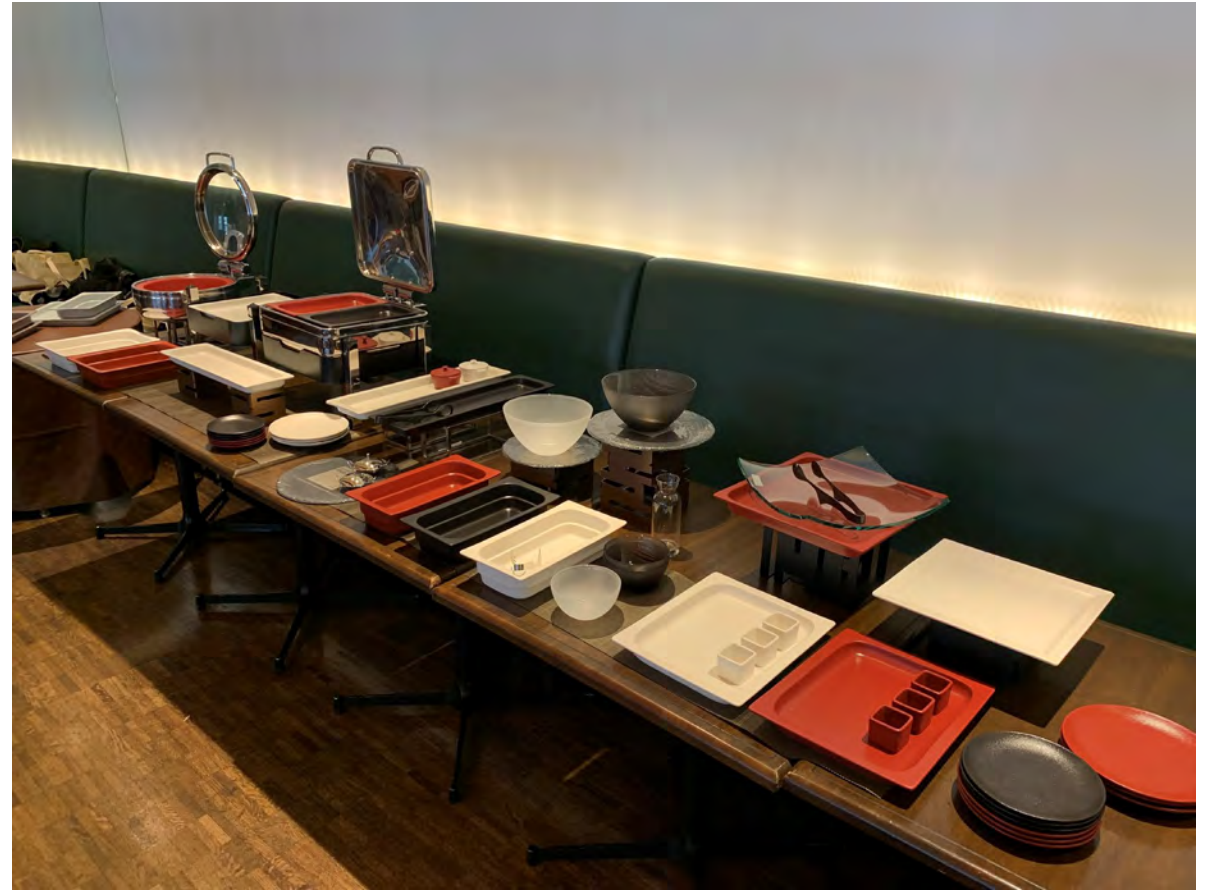
RAK GASTRONORM / ミヤザキ食器