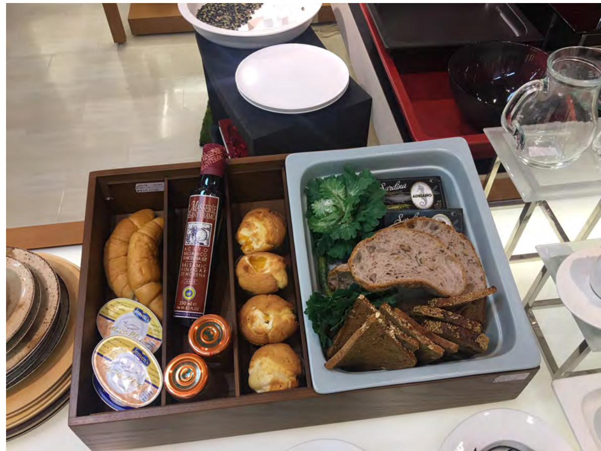
RAK GASTRONORM / ミヤザキ食器