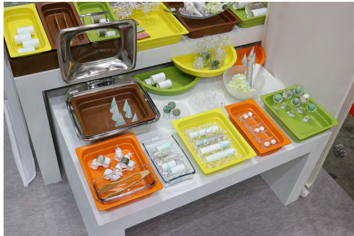
RAK GASTRONORM / ミヤザキ食器