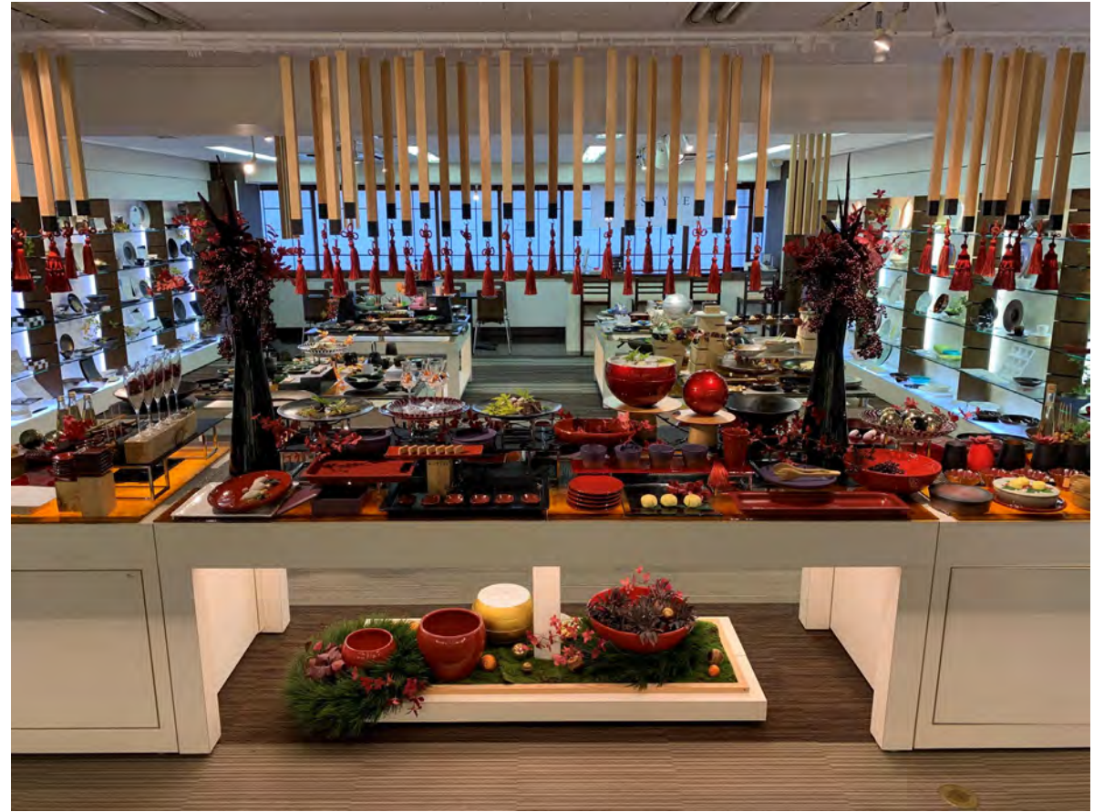
RAK GASTRONORM / ミヤザキ食器