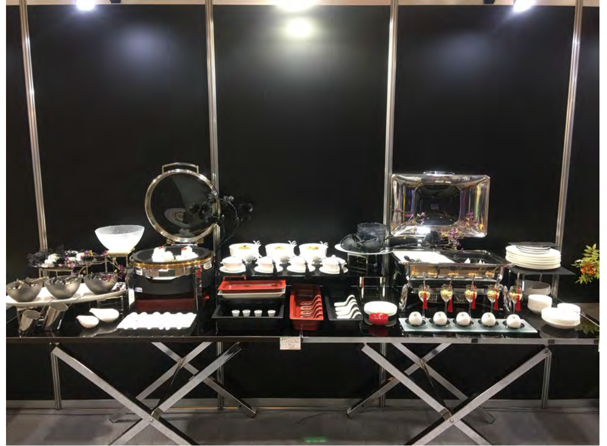
RAK GASTRONORM / ミヤザキ食器