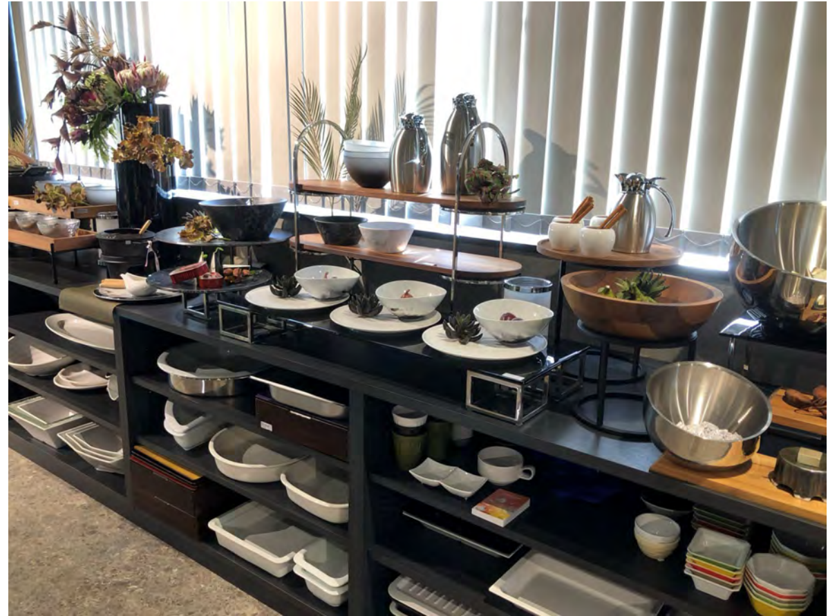
RAK GASTRONORM / ミヤザキ食器