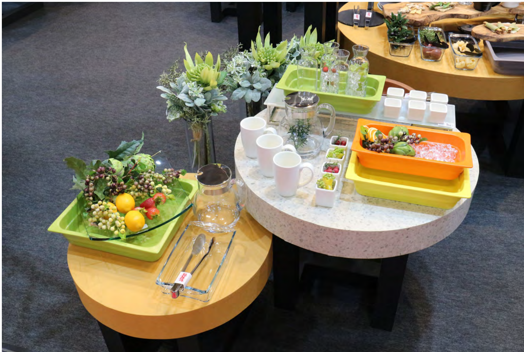
RAK GASTRONORM / ミヤザキ食器