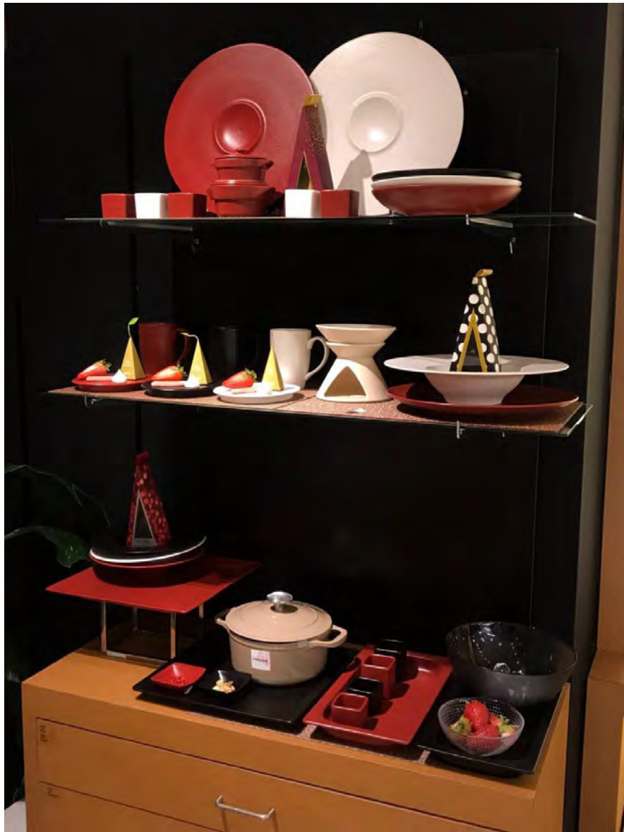
RAK GASTRONORM / ミヤザキ食器