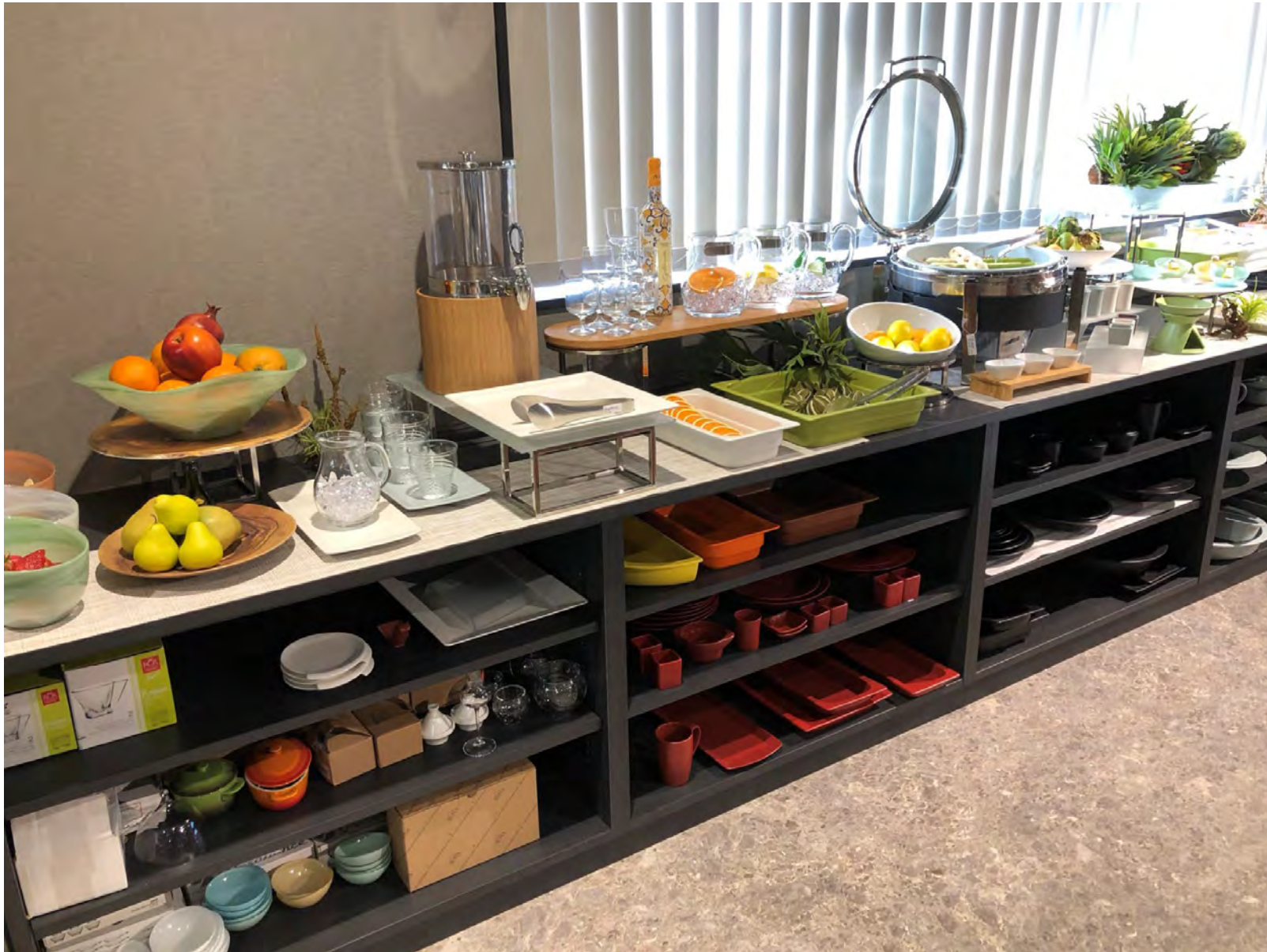
RAK GASTRONORM / ミヤザキ食器