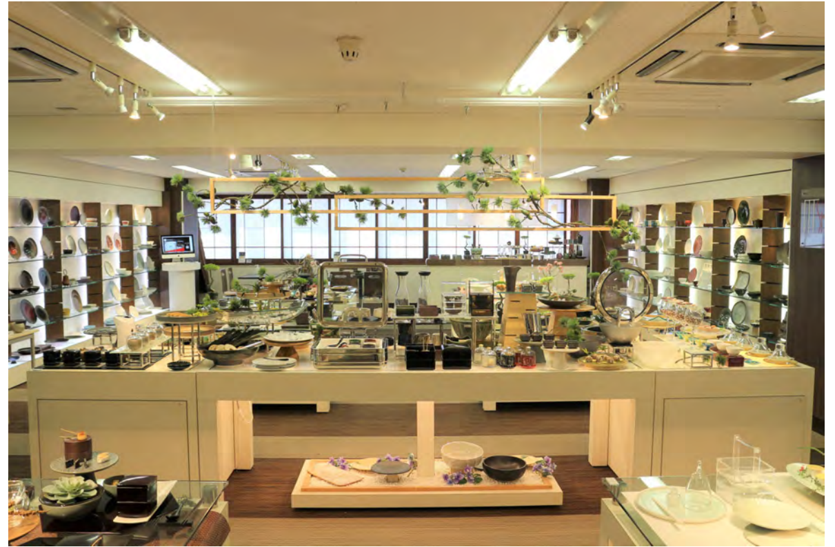
RAK GASTRONORM / ミヤザキ食器